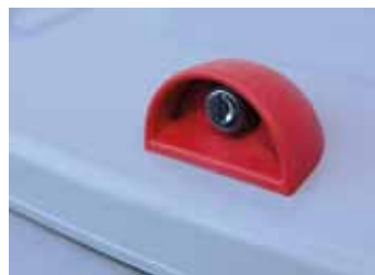
Schloss | lock