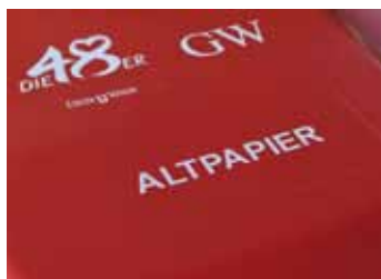
Heißdruck | hotprinting